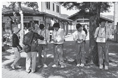
街頭募金：長瀬駅前(長瀬中学校生徒)

この赤い羽根共同募金運動でいただいた募金は、町内遊具、ベンチの設置・修繕などに使わせていただいております。