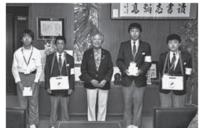
職域募金：長瀬町役場(長瀬中学校生徒)