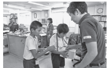
職域募金：(株)秩父イワサキ(長瀬第二小学校児童)