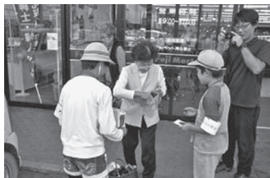
街頭募金：フジマート長瀬店(長瀬第一小学校児童)